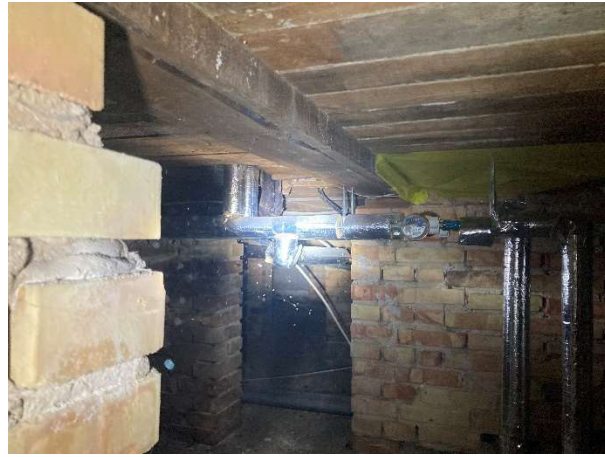
Billede 2. Krybekælder generelt.