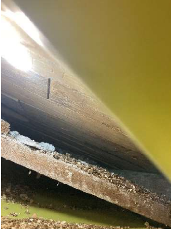
Billede 1 – Underside af gulvet.